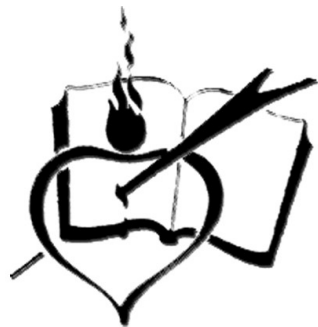
Insignia da ring Agustinos

king capamalatan ning metung a escapulario ning Nuestra Señora ning Monte Carmelo a kinuintas na king batal na manibat na canita angga king horas ning keang camatayan, bilang paganaca caya king catingcungan a papatan na king keang sarili king pamamintu na caniting divina Seniors king capamalatan ning tamac a capamintuan na caring cautusan ning Cabanalbanalan nang Anac, i Cristong Ginu tamu. Caniti na timbal ing metung a alang tugut at mayubung paganaca king pakicuanan nang suportahan ne ing keang pibalebale king pamagobra na antimo ing inutus ning Dios caya. Perati na king keang caisipan ing Pamailasa ning Cayumuyumuan tamung Miniaclung a i Jesus, iniasa't nanu man ing depatan na at pibabata, a paua nang inagum king dapat na't casakitan ning Ginu alangalang kecatamu king cabanalbanalan nang pamibiebie, dinaun na ngan king Keang Divinong Camalan.