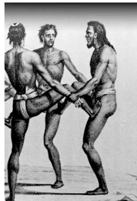
Ding Chamorro ning Marianas (Guam ngeni)