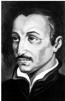
Fr. Diego Luis de Sanvitores